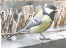
En musvitfamilie kan under opfostringen af et kuld unger spise mellem 10.000 og 15.000 insekter.