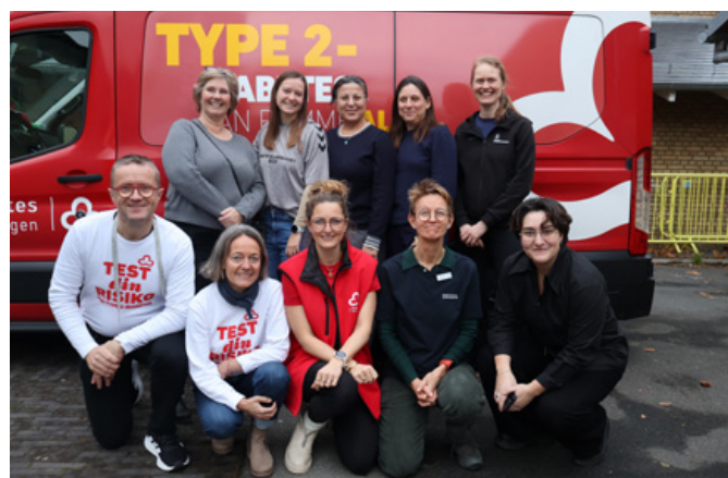
Lokale sundhedsaktører foran Diabetesbussen efter vellykket Sundhedscafé-dag.

Det handler om at opspore sygdommene tidligt og hjælpe beboerne videre til de rette undersøgelser og be-