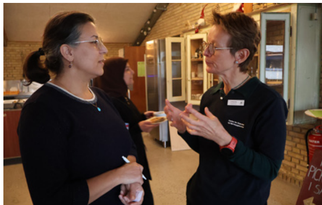
Fagfolk og engagerede beboere fik gode snakke om sundhed.