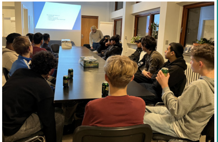
25 unge mødte engagerede op over tre aftener.

hyggeligt fællesskab og gjorde det måske lidt lettere at ’sluge’ et ellers ret voksent og komplekst emne, som investeringer jo er!