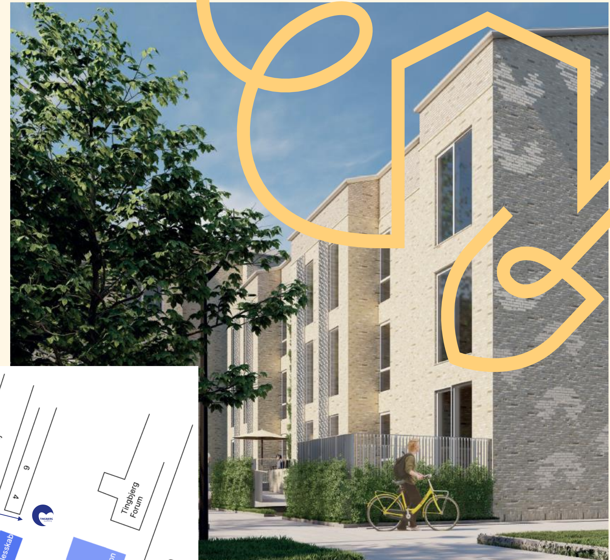
Visualisering af seniorbofællesskabet set fra haverummet: INNOVATER | ERIK arkitekter